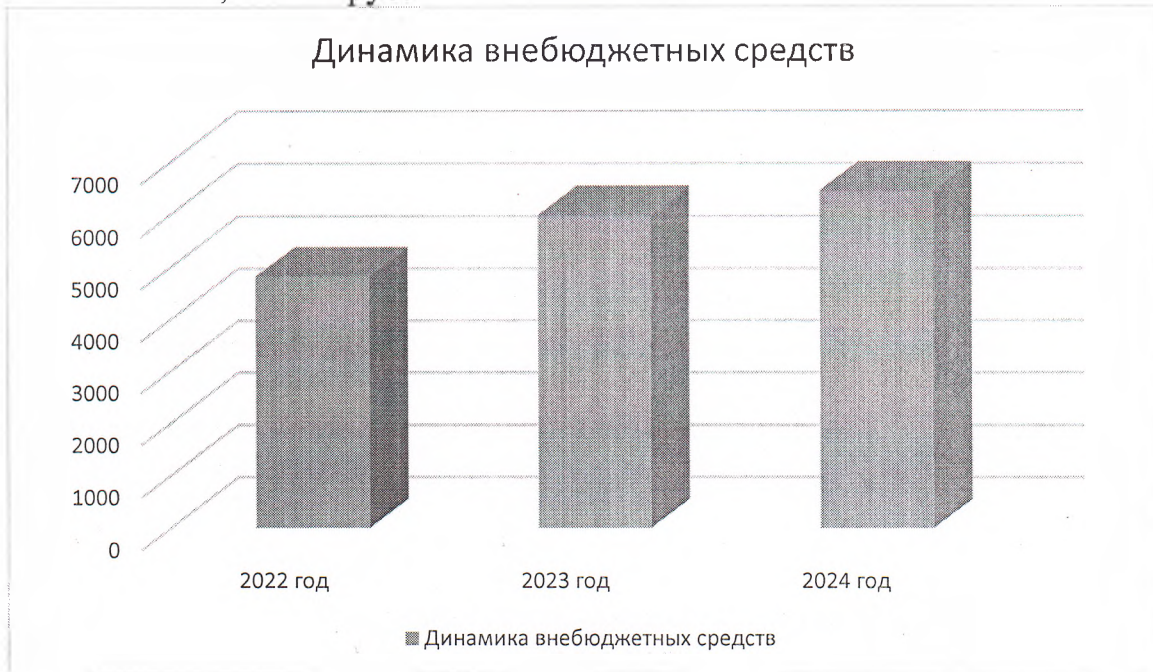
Рис. 5 Динамика внебюджетных средств

9. Динамика внебюджетных средств представлена на рис. 5 2022 г. – 4826,45 тыс. руб. 2023 г. – 5987,35 тыс. руб. 2024 г. – 6450,72 тыс. руб.