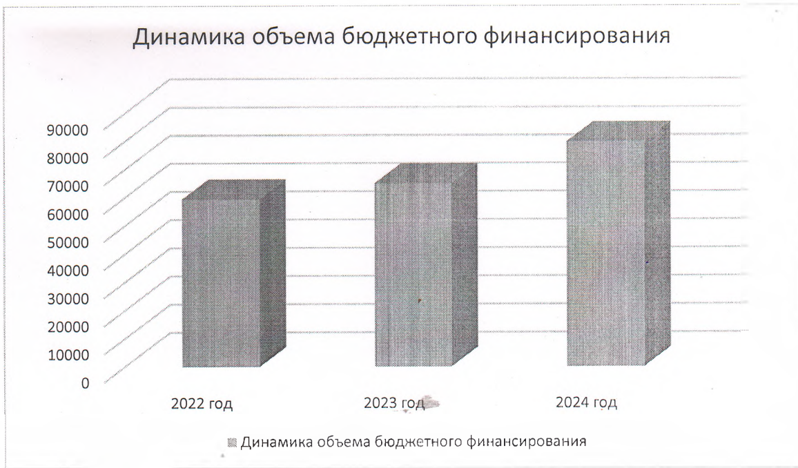
Рис. 4 Динамика объема бюджетного финансирования

9. Динамика внебюджетных средств представлена на рис. 5 2022 г. – 4826,45 тыс. руб. 2023 г. – 5987,35 тыс. руб. 2024 г. – 6450,72 тыс. руб.